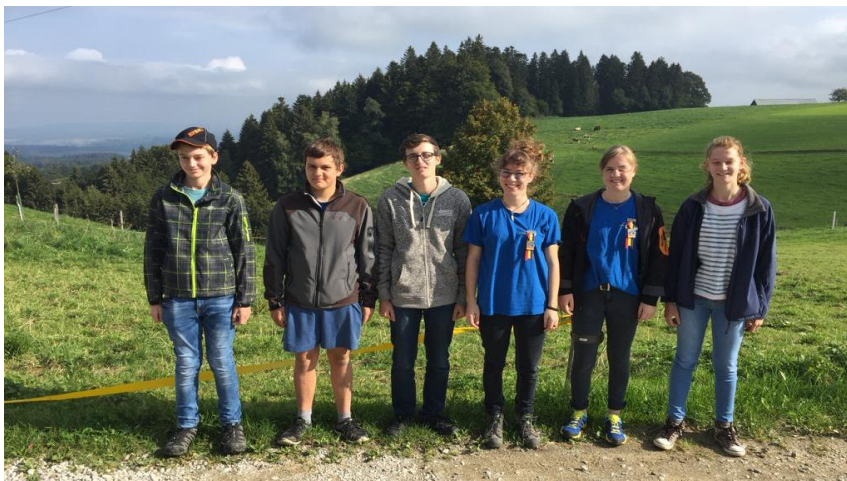
Kantonaler Nachwuchstag in Guggisberg